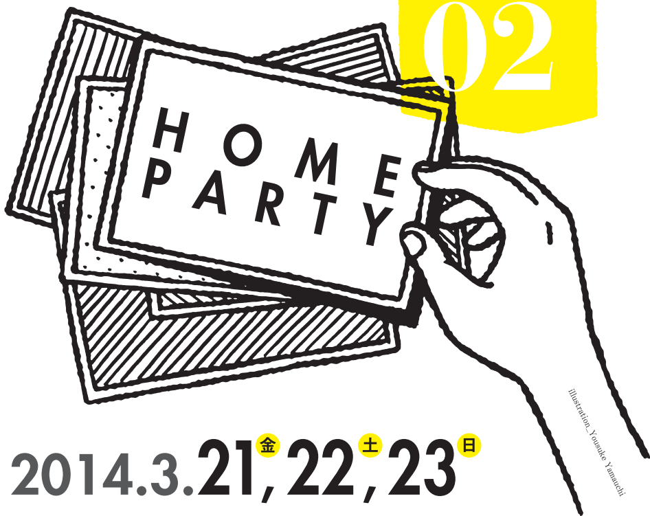
Illustration: Yosuke Yamauchi