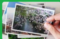
生きるということ(再制作) 2013年 Digital Photo

林 勇氣 Yuki Hayashi 1976年生まれ 兵庫県在住 映像作家/膨大な量の写真を切り抜き、重ね合わせることでアニメーションを制作している。