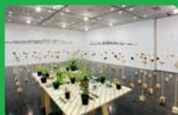
[NEW OPEN AREA]開催風景

山内 庸資 Yosuke Yamauchi 1978年生まれ 兵庫県在住 画家、イラストレーター/「FACE SHOP」の展示監修を務める。 http://yosuke-yamauchi.org