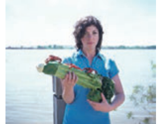
©Tsuoyoshi Ozawa Courtesy of MISA SHIN GALLERY 小沢剛 「ベントプラ・ウェポンザリガニ・エトワフェニニューオリンス」