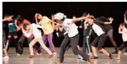
「インターナショナルワークショップフェスティバル DOORS 8th」ワークショップ風景より